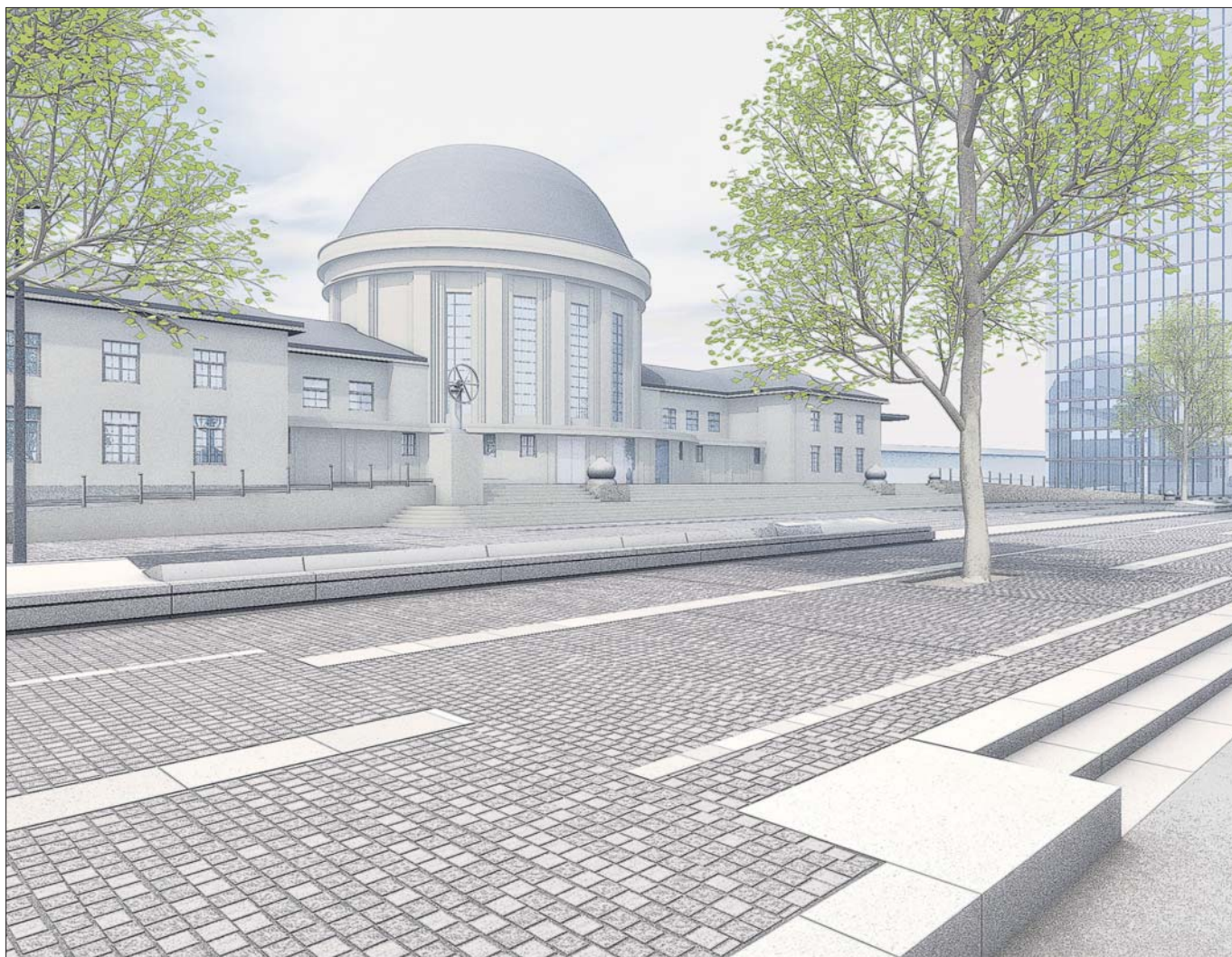
Neugestaltung des Ottoplatzes am Bahnhof Köln Messe/Deutz